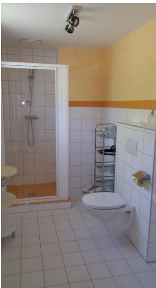
2.Badezimmer mit Schlafzimmer