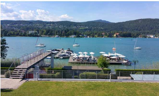
Badeplattform und Marina