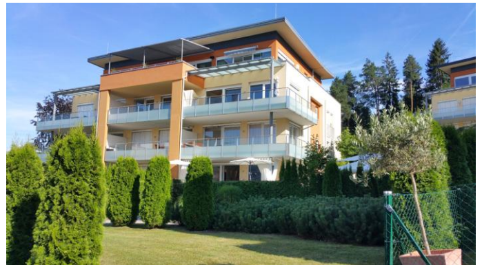
Ansicht vom See