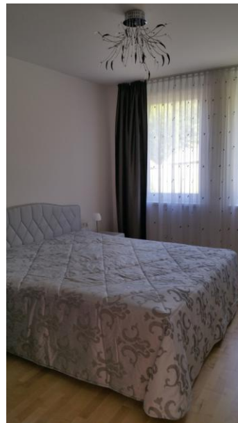
Schlafzimmer und Flurr